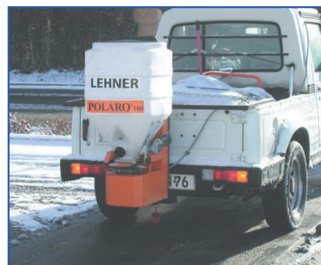
POLARO® 100 op een pick up wagen met sneeuwruimblad