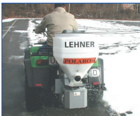
POLARO® 70 op een ATV met sneeuwruimblad