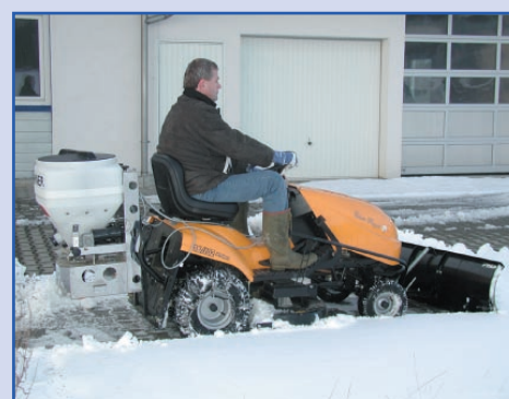
POLARO® 70 op een maaimachine met sneeuwruimblad

Dankzij de 12 volt aandrijving kan de POLARO® overal gemonteerd worden.