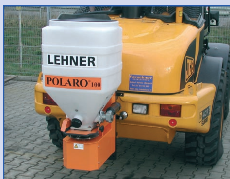
POLARO® 100 op een shovel