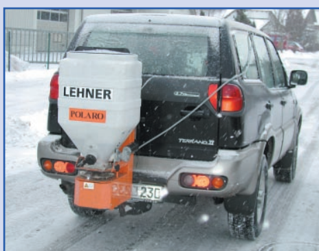
POLARO® 100 op een terreinwagen