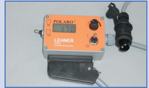
Bedieningspaneel voor de afstandsbediening

Door de traploze regeling van het toerental van de strooischijf kan de strooibreedte van 0,8 m (voetpad) tot 6 m (bushalte, parkeerplaats) tijdens het rijden traploos worden ingesteld.