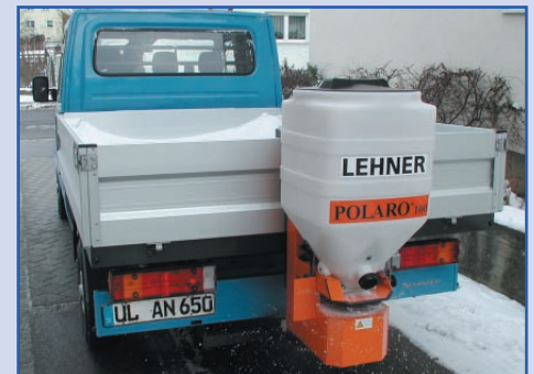
POLARO® 100 op een pick up wagen